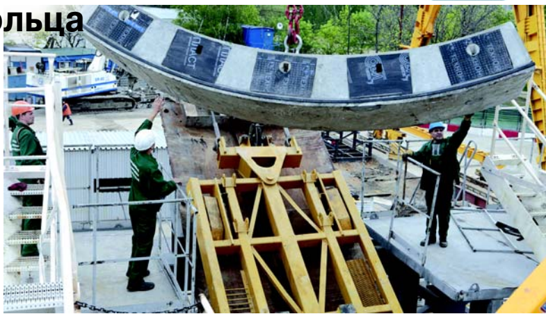
Блок для первого кольца обделки.