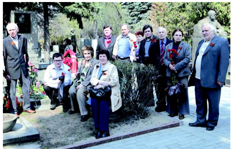
У памятника Михаилу Афанасьевичу Самодурову.

Транспортные строители выражают искренние соболезнования родным и близким покойного. Светлая память об этом замечательном человеке навсегда останется в сердцах людей, знавших его.