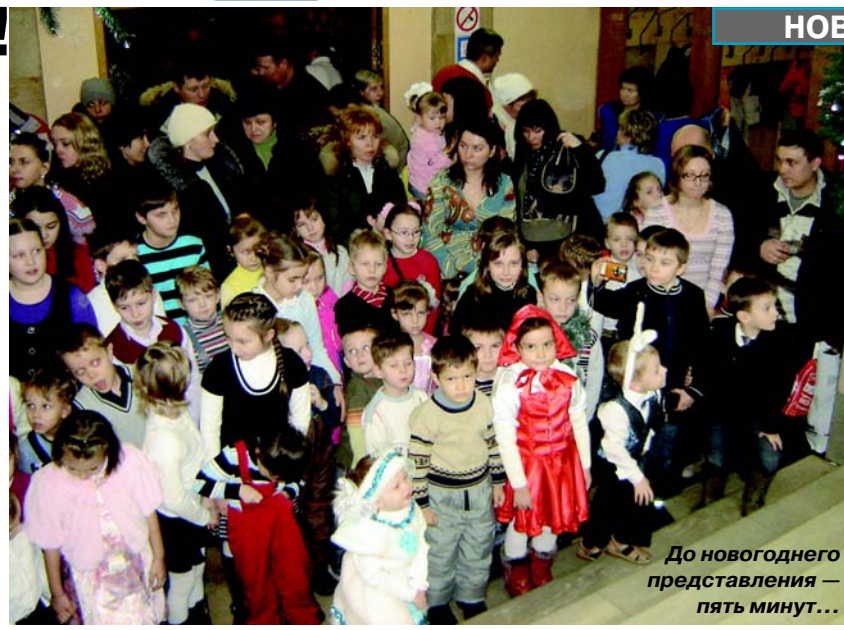
До новогоднего представления — пять минут...