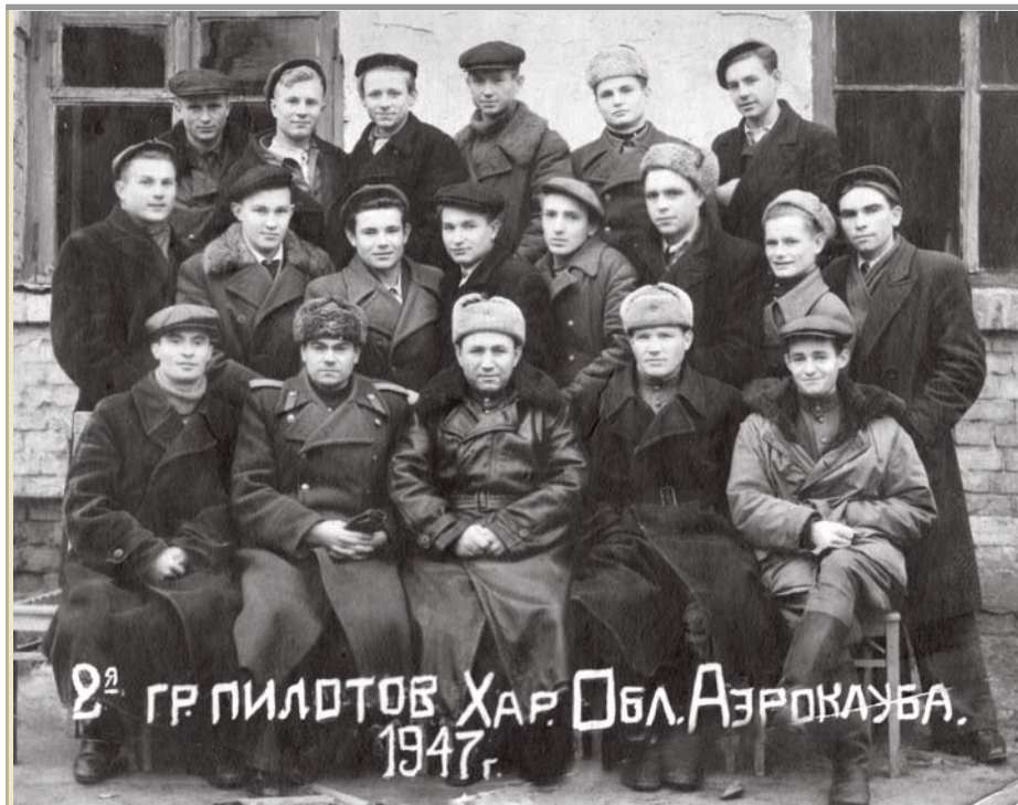
2 я гр. пилотов Хар. обл. Аэроклуба. 1947г.

Нариман, Нариман, и поныне Горизонт Ваш безоблачно чист. Вы, как прежде, противник унынья И первой статьи оптимист!