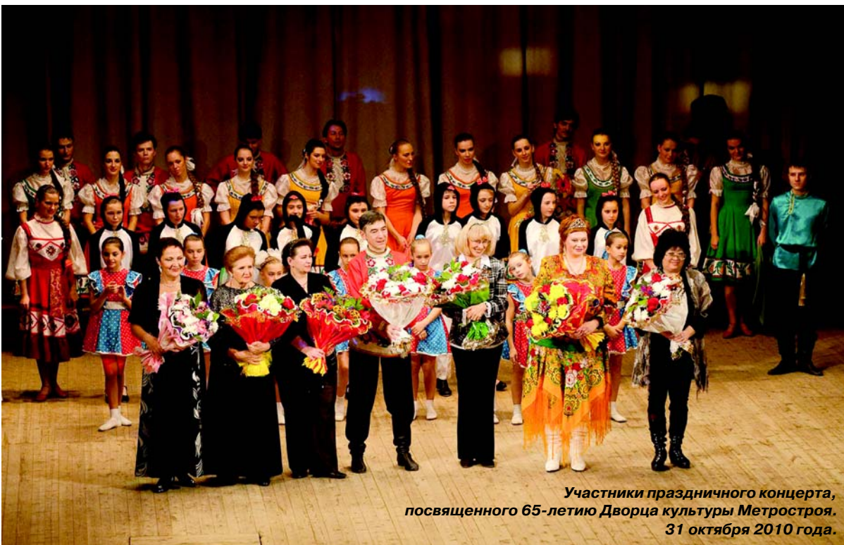
Участники праздничного концерта, посвященного 65-летию Дворца культуры Метростроя. 31 октября 2010 года.