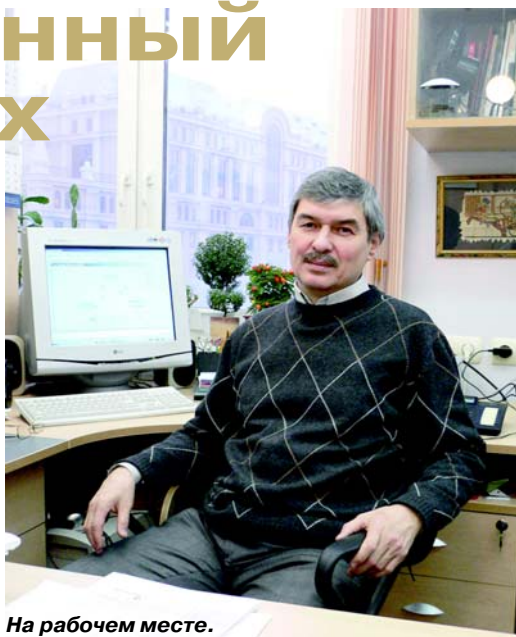
На рабочем месте.