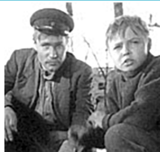
Василий Шукшин в фильме «Два Федора».

нил, что в «Кругозоре» работает парень, который и песни пишет, и поет, и вообще очень заводной. Впервые увидев Визбора, я сразу обратил внимание на его незажатость, раскованность и попросил что-нибудь спеть.