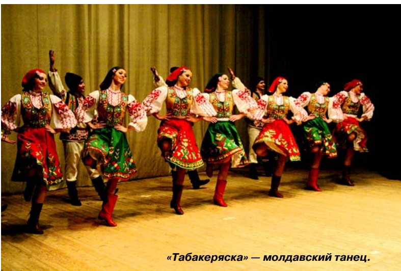
«Табакеряска» — молдавский танец.