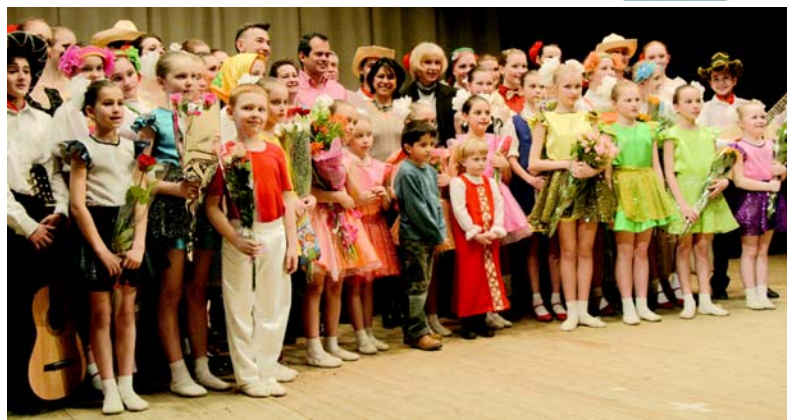
Участники ансамбля танца «Кудринка» с руководителями коллектива и гостями из мексиканского посольства. нял участие в фестивале «Мы живем в России». И снова стал лауреатом, что говорит о высочайшем уровне мастерства его исполнителей.