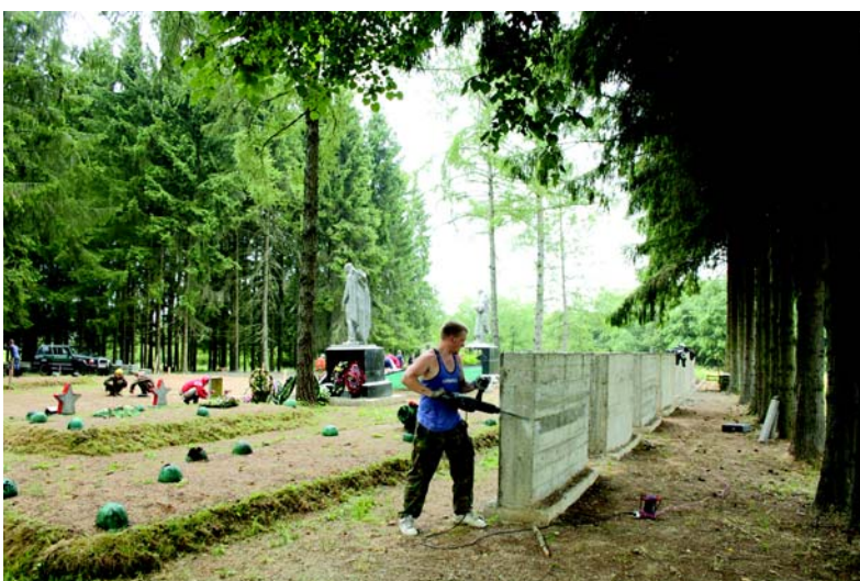
На каждой стеле ребята закрепили таблички с именами погибших.