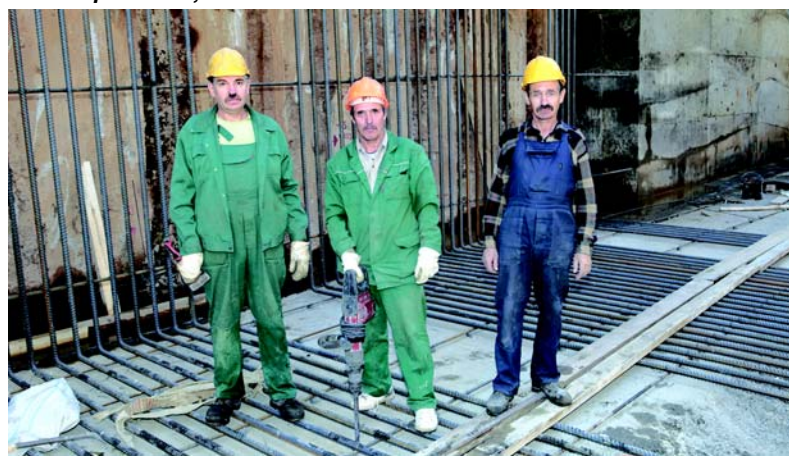
ВЕСТИ СО СТРОЕК

хотя свод у нее задуман проектировщиками нестандартный — с оригинальными кессонами. Но с этой нестандартностью СМУ-3 спокойно справляется.