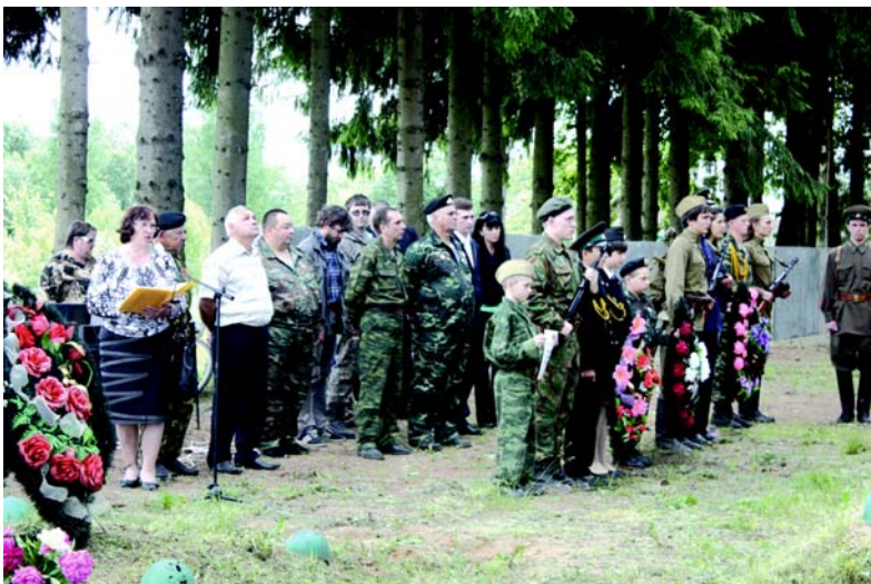
Памяти павших будем достойны!