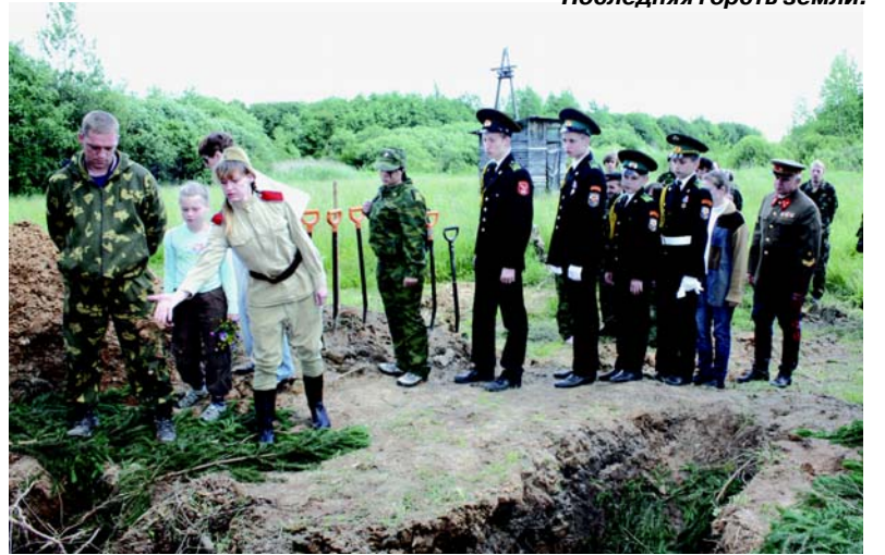
Последняя горсть земли.

ребята его обожали. И он остался доволен, сказав, что это была лучшая неделя прошедшего лета.