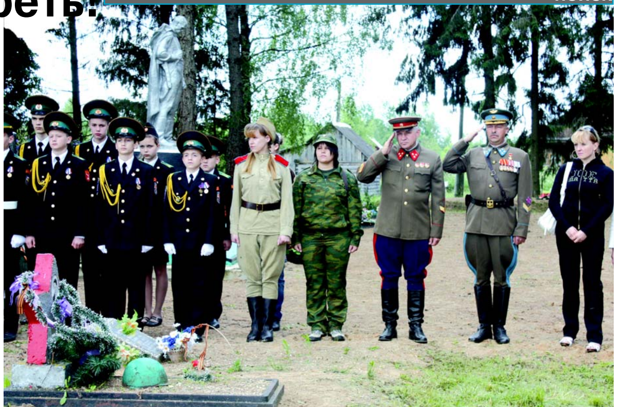
В составе отряда «Память Метростроя» на захоронение останков советских бойцов, погибших в Тверской области, выезжали кадеты 1-го кадетского корпуса.