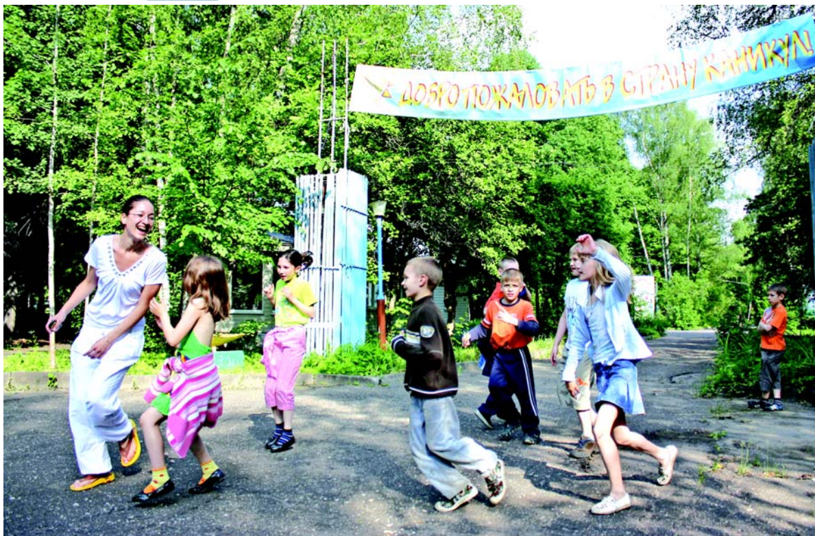
Бегом — в страну каникул!

В «Юном метростроевце» была создана и успешно реализована система детского самоуправления: работал пресс-центр, который отвечал за информационное обеспечение всей детской аудитории, регулярно проходили сборы дежурных командиров, где обсуждались пла-