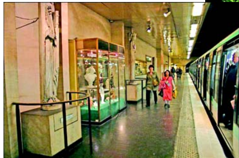
На станция метро у Лувра находится часть античной экспозиции музея.

В парижском метро 14 пронумерованных «больших» линий плюс две короткие, бывшие ответвления