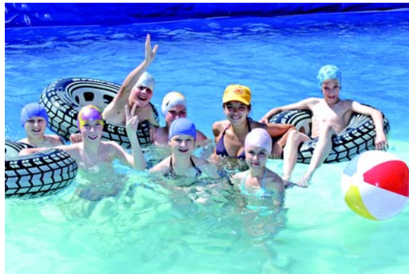
Бассейн был настоящим спасением для ребят в жаркие дни. Можно было не просто купаться и учиться плавать, но и поиграть.