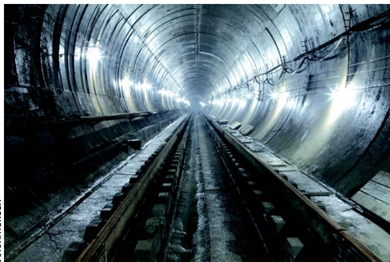
Новый тип пути на лежнях, освоенный метростроителями Т0-6.