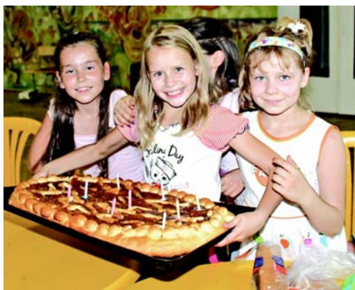
Девять лет — прекрасный возраст. Какой замечательный пирог для виновницы торжества!