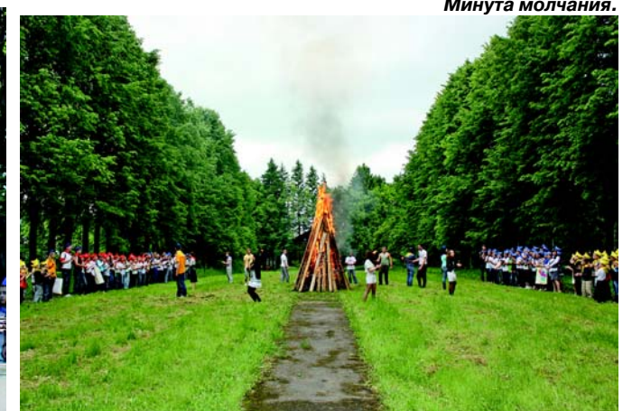
Гости из Москвы и ребята второй смены на торжествах, посвященных 65-летию лагеря «Юный метростроевец».