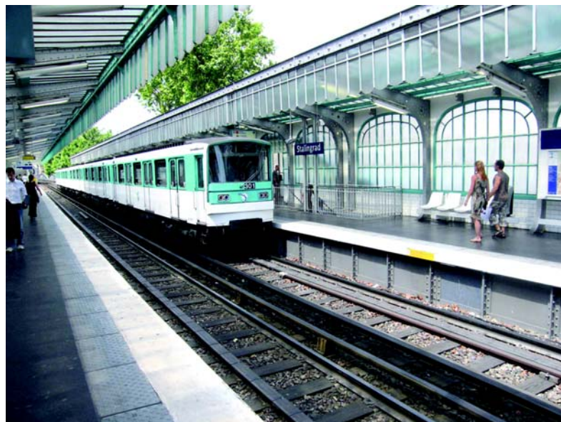
Вход на станцию парижского метро.

Первые линии прокладывались строго под проезжей частью улиц — ведь земля под улицами принадлежала городу, а под домами была частной, и её пришлось бы выкупать. Некоторые станции даже имеют криволинейные платформы из-за формы