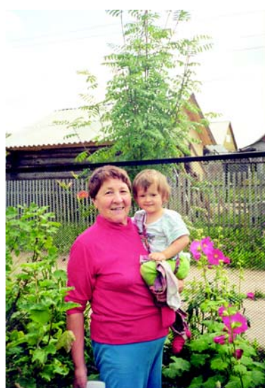
Прабабушка с правнучкой на даче в Михневе.