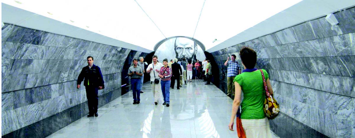
С пассажирами метро «знакомится» сам Фёдор Михайлович Достоевский.