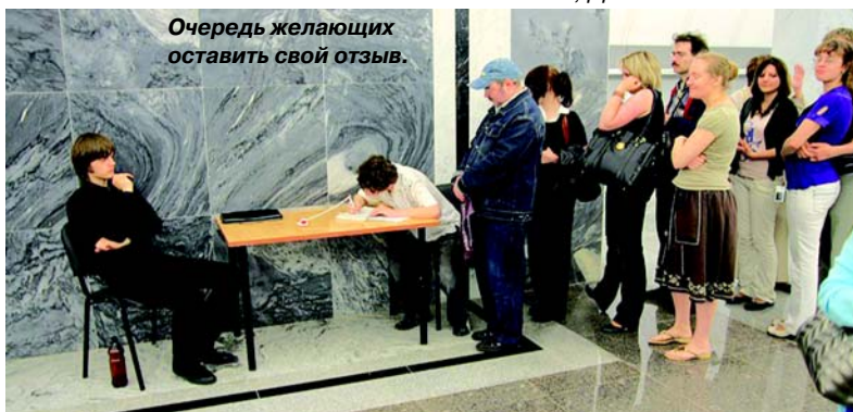
Очередь желающих оставить свой отзыв.