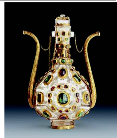
Кувшин с двумя носиками.

Среди личных вещей правителей демонстрируются парадные кафтаны, головные уборы, письменные приборы, великолепные образцы посуды. В разделе «Оружие и военное снаряжение» — старинные турецкие шлемы, боевые топоры, сабли, мечи и другие образцы холодного оружия. «Повседневная жизнь дворца» представлена великолепными образцами посуды из китайского фарфора, меди и серебра.