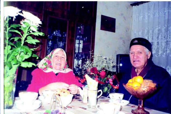
Счастливы вместе. Супруги Зайдуллины за чашкой чая.