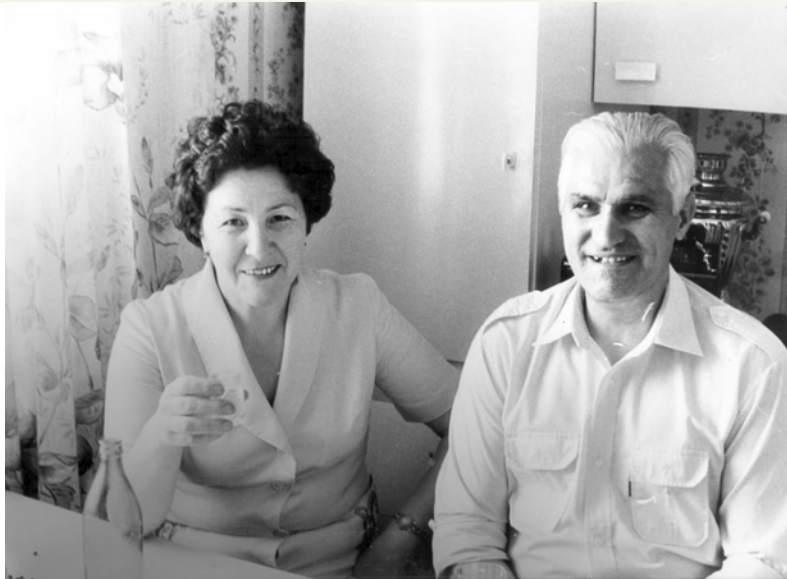
В новой квартире. 1980-е годы.