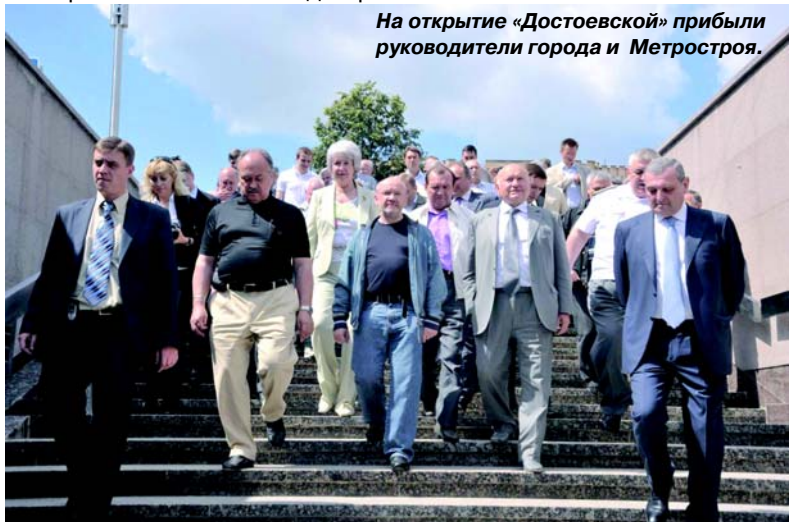
На открытие «Достоевской» прибыли руководители города и Метростроя.

но, радость, особенно если учесть, насколько прекрасные сооружения могут возводить наши метростроители».