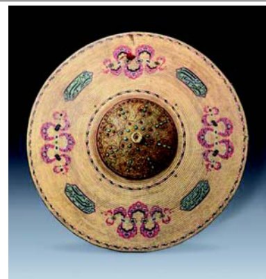
Щит «калкан». XVI век.

девров ювелирного искусства, украшавших некогда покои султанов. Большая часть экспонируемых памятников — именные вещи, способные много поведать об их владельцах. Турецкие правители предстают перед посетителями не только как воины и государственные деятели, но и как истинные ценители прекрасного, собиратели коллекций и покровители искусств.