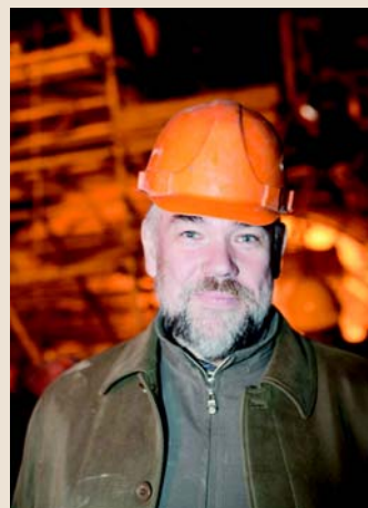
Автор мозаик — народный художник России С.В. Горяев.