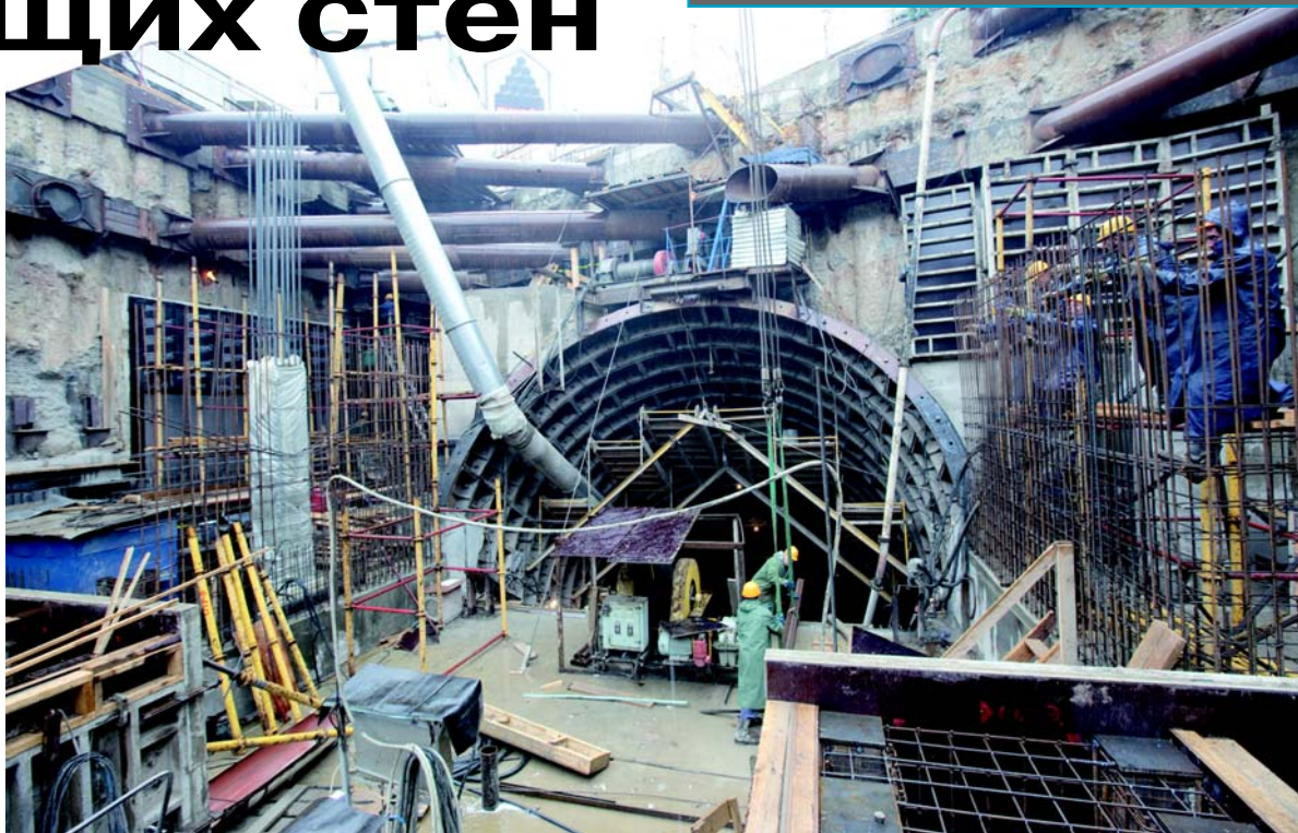
Вид из вестибюля на наклон.