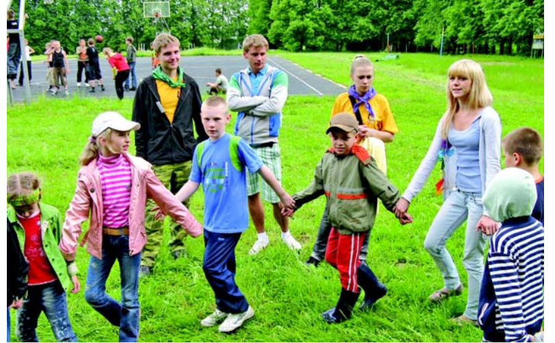
На поле игровом.

ливом детстве. Ребята старшего возраста приняли участие в просмотре фильма Михаила Ромма «Обыкновенный фашизм», после чего состоялся открытый и серьезный разговор на тему: «Что я знаю о фашизме?» Дети думали, рассуждали, спорили... Но самое главное — это то, что они помнят про героическую историю своего народа, хотя знают больше и верят в силу своей Родины.