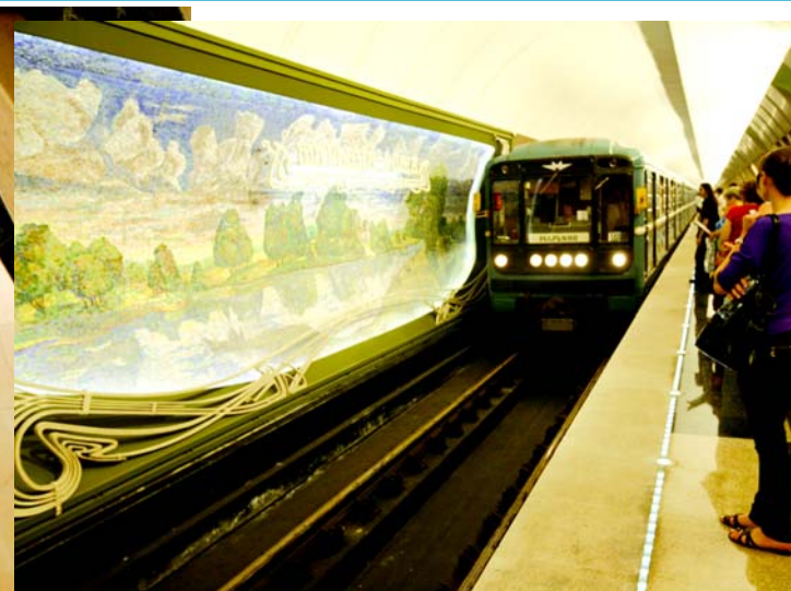
От «Марьиной Рощи» курс — на «Марьино»!