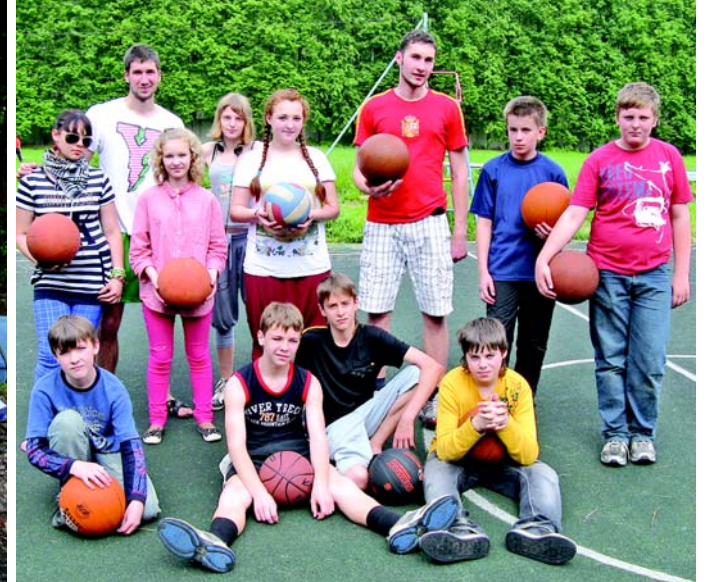
Мы все — спортсмены.

УЧРЕДИТЕЛЬ — ОТКРЫТОЕ АКЦИОНЕРНОЕ ОБЩЕСТВО «МОСКОВСКИЙ МЕТРОСТРОЙ»