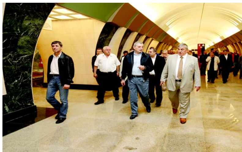
Ю.М. Лужков поздравляет всех с праздником пуска новых станций.