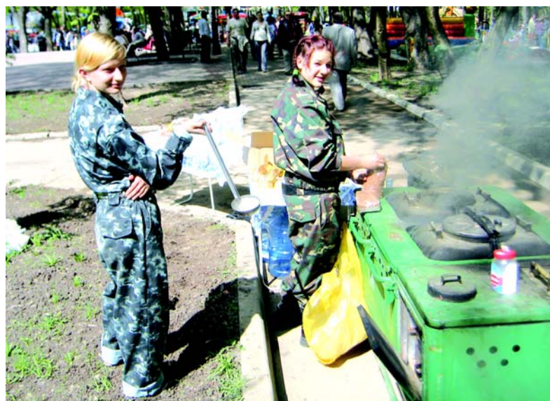
В майские дни ребята из отряда «Память Метростроя» устраивали в парках города полевые кухни. И дети, и взрослые с большим удовольствием угощались гречневой кашей.