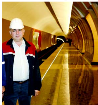
Первый поезд для пассажиров на станции «Марьяна Роща».

На блистающей чистотой платформе станции за последние дни уже ничего не менялось, лишь накануне на ней, ближе к наклону, устроили помост с микрофоном, а в