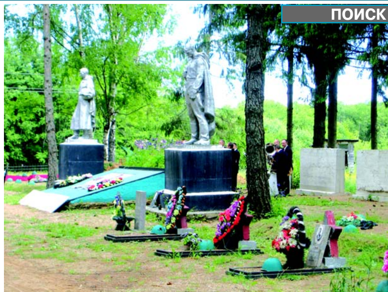
Мемориальный комплекс, строительство которого в поселке Погорелое Городище Тверской области

Военная подготовка в десантной воинской части.