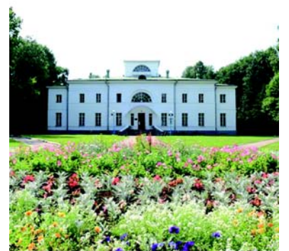
Дом графов Олсуфьевых в Ершове.

Петровское князей Голицыных — одно из лучших подмосковных творений зодчего М.Ф. Казакова. Петровское получило известность еще в екатерининскую эпоху. Поначалу оно принадлежало известному предпринимателю-металлургу, кровителю Московского университета Н.А. Демидову. А название поселка произошло от названия церкви, освещенной во имя святителя Петра. К сожалению, главный дом представляет сегодня собой руины, сохранились только флигели, ворота, две церкви. Но, тем не менее, путешественников притягивает сюда сам воздух, сама атмосфера, которая уводит в далекое прошлое.