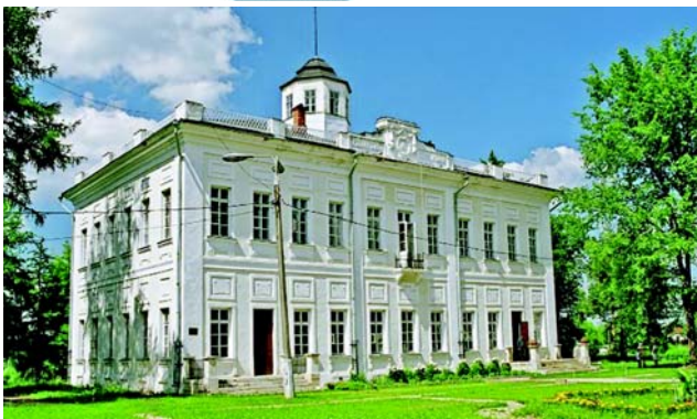
Усадьбный дом Голицыных в Больших Вяземах.

осадное сидение» 1612 года. Потом оно принадлежало боярину И.А. Милославскому, затем обер-гофмаршалу Н.М. Голицыну, владельцу Больших Вязем. А дальше уже царь Павел I подарил его своей фаворитке Анне Лопухиной. В 1884 году