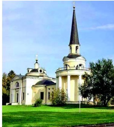
Церковь Преображения Господня во Введенском.