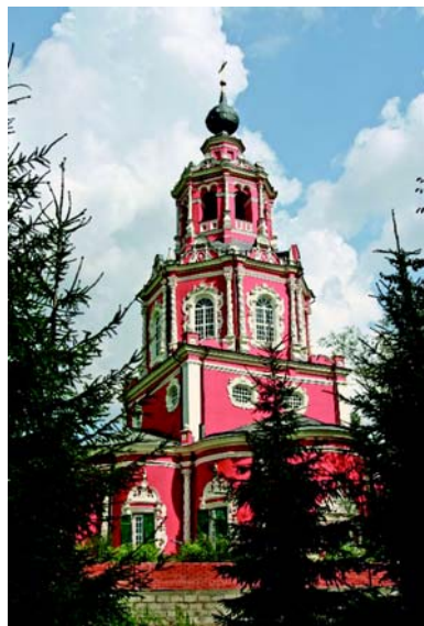
Церковь Спаса Нерукотворного в селе Уборы.

При Алексее Михайловиче здесь началось широкое строительство. В 1650–1656 годах возводится новый монастырский ансамбль, окруженный кирпичными на белокаменном фундаменте стенами с семью башнями. Внутри стен были построены Царский дворец и Царицыны палаты — для первой жены царя Марии Ильиничны Милославской, Троицкая церковь — домовый храм царицы, трапезная палата, братские корпуса, звонница. Мастер Алек-