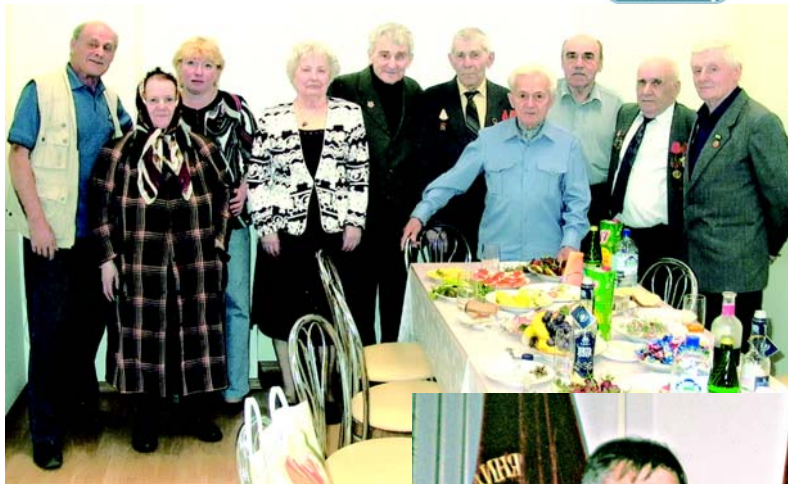
Участники майской встречи в СМУ-8 в 2008 году.