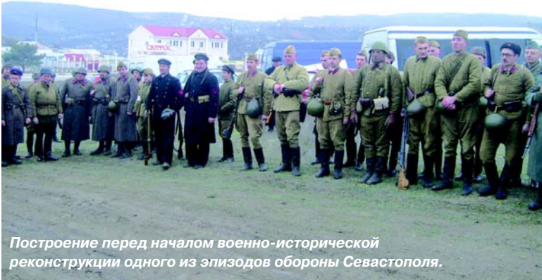
Построение перед началом военно-исторической реконструкции одного из эпизодов обороны Севастополя.