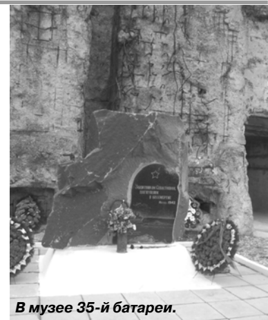
В музее 35-й батареи.

солдаты и матросы, оставленные без всякого снабжения и без надежды на эвакуацию, отчаянно сражались до последнего патрона, пытаясь пробыть к своим. А 1 июля 1942 года 35-я батарея выпустила последние 6 снарядов прямой наводкой по наступающей пехоте противника. В ночь на 2 июля командир батареи Лещенко организовал подрыв батареи. Бой в помещениях цитадели продолжался до 9 июля, когда про-