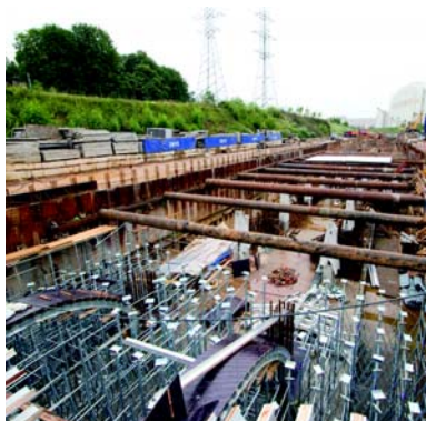
На снимках Александра Попова — памятные кадры строительства Митинско-Строгинской линии