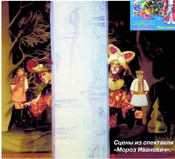
Сцены из спектакля «Мороз Иванович».