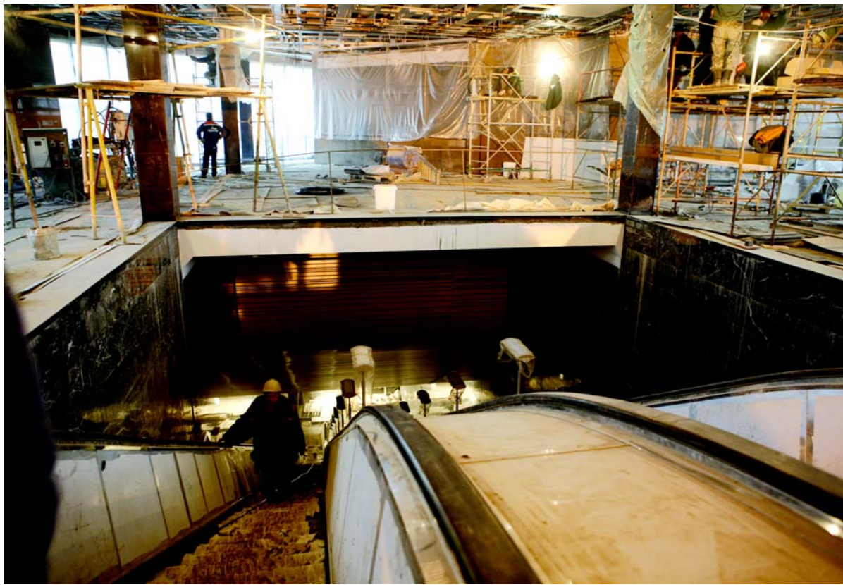
Эскалаторы вестибюля №2.

Внешне все три эскалаторные ленты выглядят полностью собранными. Лишь только в верхней части немного не доведен до конца монтаж элементов балюстрад. А все светильники, например, уже заняли свои места и лишь до поры прикрыты защитной пленкой. Ступени одной из неподвижных пока лестниц застелены длинным полотном. Точно так же было и в ноябре на вестибюле №1 — для прохода на платформу журналистов, которым пред-