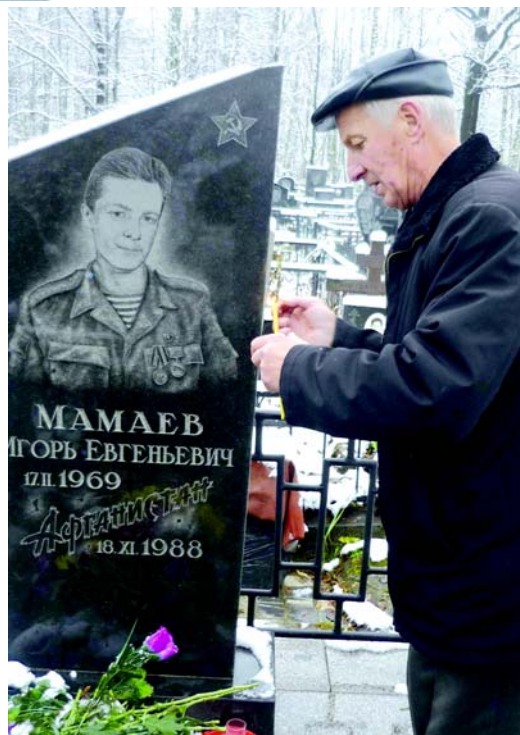
Отец зажигает свечу на могиле сына.