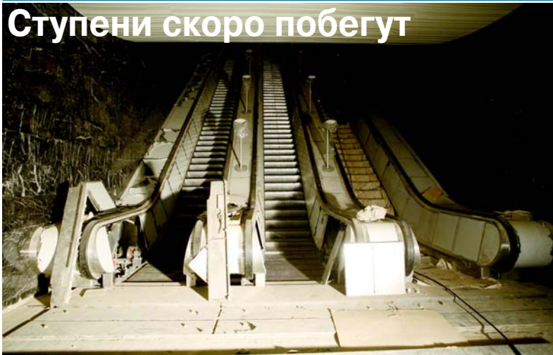
Окончание, начало на стр. 1

и не безоглядно, воспринимают всё новое.