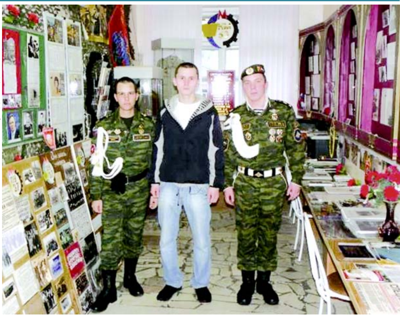
Выпускники в музее колледжа.

профессионального образования. Перед армией они окончили трехгодичное обучение по профессии электромонтажник. Им не мешает поднять уровень своей подготовки. Парни обещали подумать.