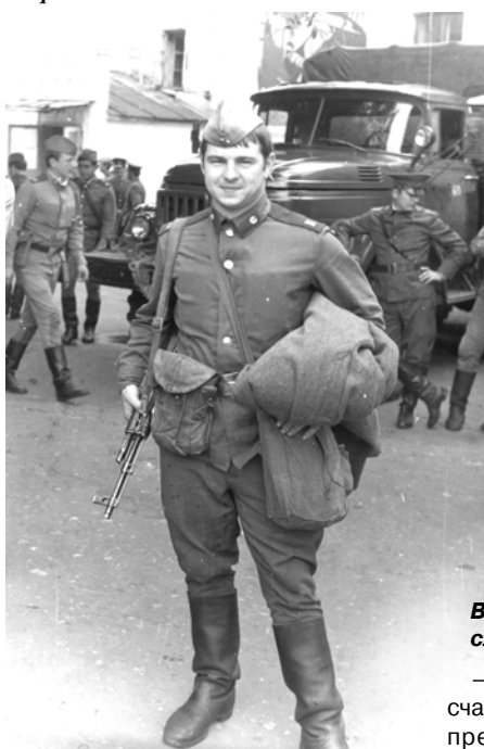
В период армейской службы. 1980 год.

Но эту трудную социальную проблему невозможно решить, пока нет внятной государственной жилищной политики. Сравните: в конце восьми-