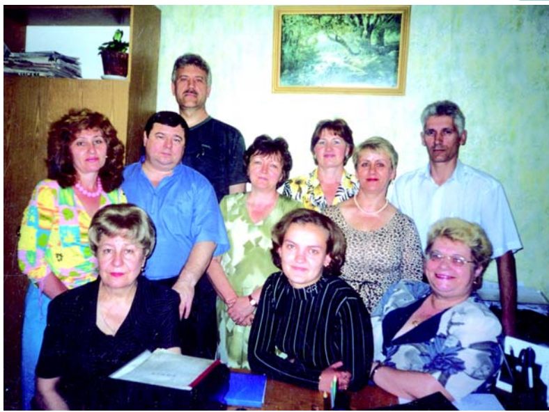
С коллегами по работе.