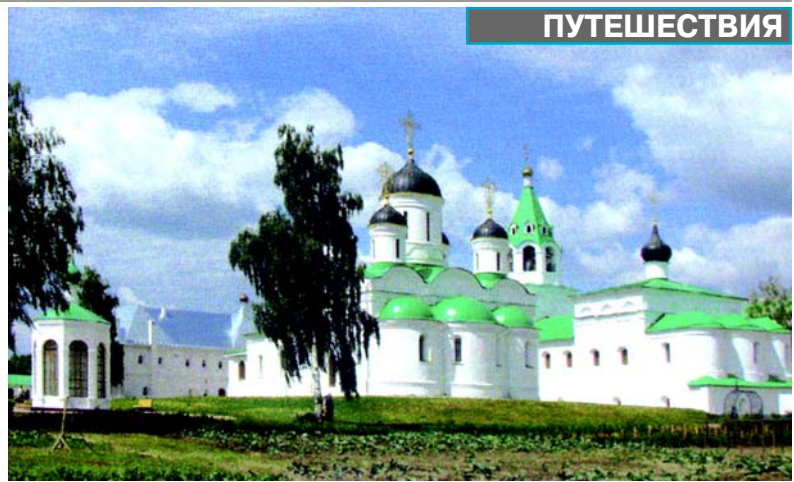
Панорама Спасского монастыря.