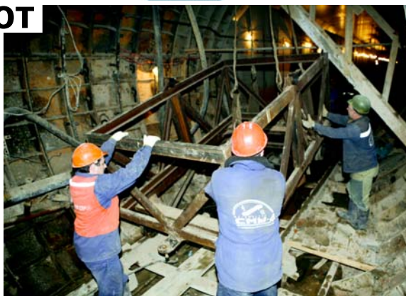
Сначала опустили в тоннель тележку...

давно справилась. Освещение сделано, силовая трасса проложена и силовые кабели заведены. Остается только подать на них напряжение и подключить к оборудованию, которое должны поставить в течение ноября.