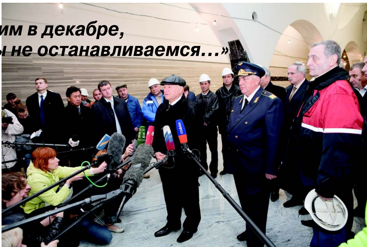
Ю.М. Лужков отвечает на вопросы журналистов.