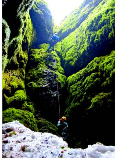
Возвращение на плато.