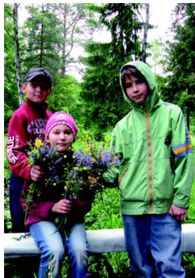
Цветы — в подарок!

В лагере регулярно проводились выходы детей на костры. Для ребят младшей группы прямо на территории отведено специальное костровое место. Дети средней и старшей возрастных групп ходили в березовую рощу.