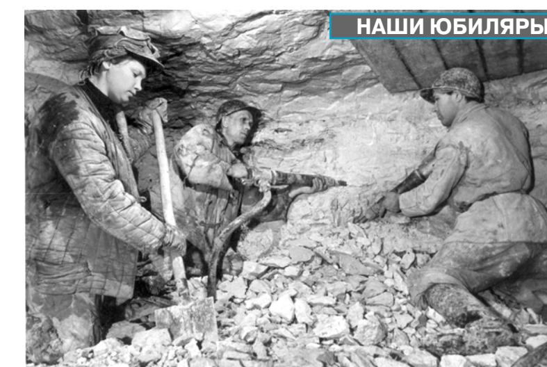
В забое «Новослободской». 1950 год.

На фабрике она работала до 1944 года. А в сорок четвертом по путевке комсомола девушку направили на Метрострой, на строительство № 6,