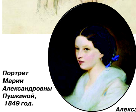
Портрет Марии Александровны Пушкиной, 1849 год.