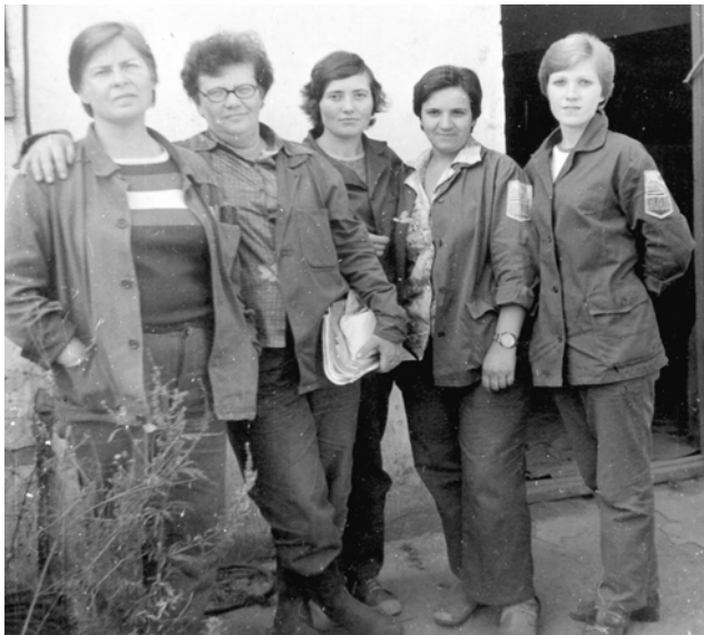
С коллегами на «Тульской». 1983 год.

необычным. Первый этаж полностью занимали жильцы, а на втором и частично на третьем располагались учебные классы школы-семилетки, которую я и окончила. Любила русский, литературу, историю и совершенно не переносила химию. Именно с химии мы с ребятами и сбегали чаще всего в консерваторию, куда нас пускали без билетов. Заберемся обычно на самый верх и слушаем с наслаждением концерт. Все завораживало: сам зал,