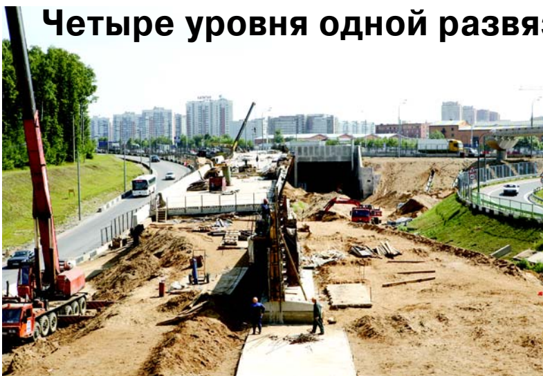
Окончание, начало на стр. 1

МО-6, МО-41, МО-114. Результаты их деятельности — виражи, взлёты и понижения эстакад — больше всего на виду. Шаг эстакадных опор как бы задаёт ритм всей развязке.