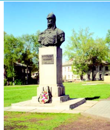
Бюст Александра Невского.

В эпоху правления Ивана Грозного город стал оплотом опричнины. Царь, мечтая перенести столицу в Вологду, рассматривал Переславль как стратегический пункт, стоявший близ дороги, ведущей на Вологду. Никитский монастырь был превращен в неприступную крепость.