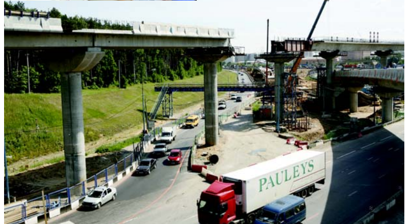
Первая эстакада почти сомкнулась.

Сразу надо отметить, что без автомобиля было бы очень сложно обойтись. Размеры строительных площадок очень велики. По кольцевой автодороге они захватывают более километра, достигая на севере поворота на Строгино. В радиальном направлении вытянулись (по проспекту Маршала Жукова и Новорижскому шоссе) более чем на два с половиной километра, уйдя далеко за Мякининский путепровод. А ведь есть ещё и треть измерение — вертикальное, так как работы ведутся на нескольких уровнях.