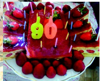
Пирог для бабушки.