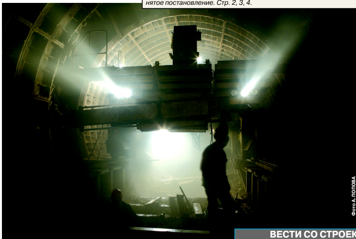
Скуратовский блокукладчик в левой камере съездов.

В ней уже смонтировано 12 тубинговых колец. Ещё через 3 кольца последует переход на диаметр 10,5 метра. Такие внушительные габариты камеры съездов лично Золотарёва не смущают. К лесам в несколько ярусов коллектив припрорвался, монтаж об-