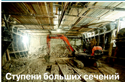
Ступени больших сечений