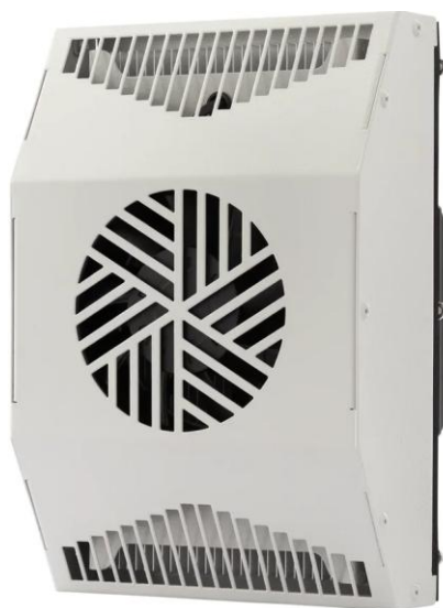
STA-122-010 Полуутопленный монтаж

Серия Российских термоэлектрических кондиционеров STA представляет семейство промышленных охладителей для работы в самых сложных условиях окружающей среды, надежно обеспечивающих защиту от перегрева чувствительной автоматики в электротехнических, телекоммуникационных шкафах, передвижных модульных установках с автономным питанием.