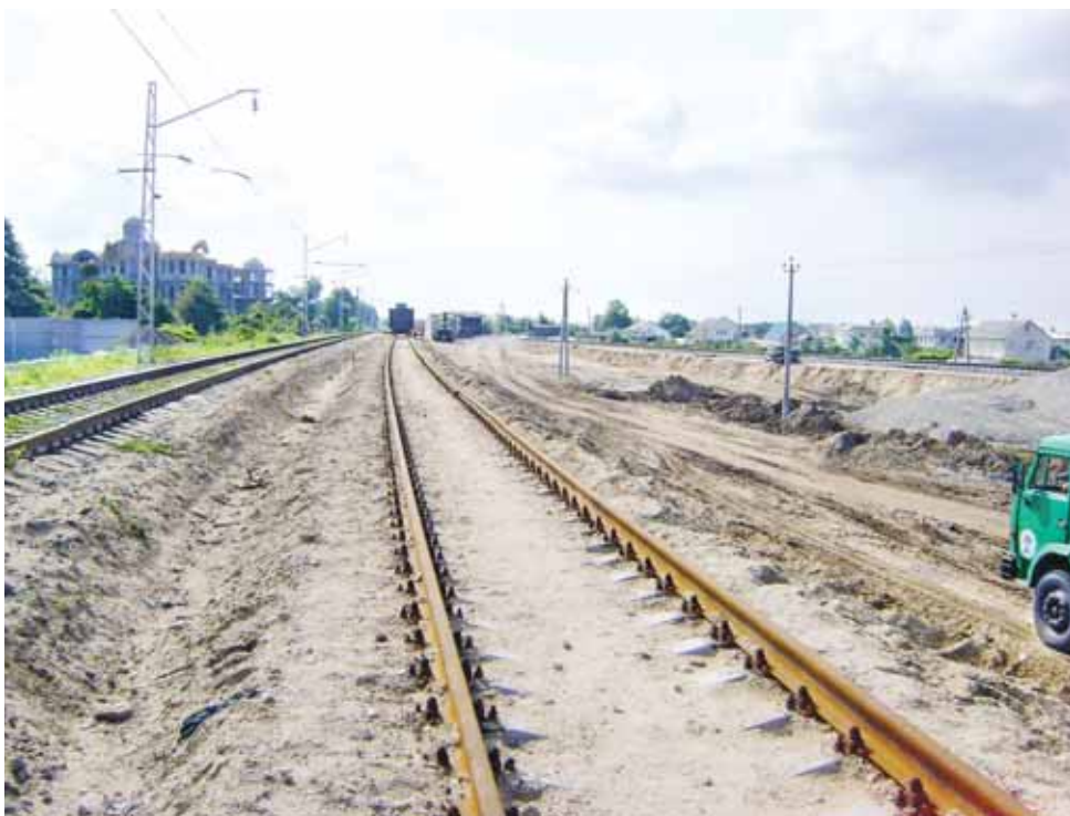
Грузовой двор: первые пути

На грузовом дворе между станциями Адлер и Веселый первый такой путь уже есть. А значит,