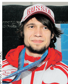
АЛЕКСАНДР ТРЕТЬЯКОВ, ОБЛАДАТЕЛЬ КУБКА МИРА, ПРИЗЁР ОЛИМПИЙСКИХ ИГР И ЧЕМПИОНАТОВ МИРА ПО СКЕЛЕТОНУ:

Хочу поздравить наших болельщиков и всех поклонников спорта с Новым годом. Надеюсь, вы будете болеть за нас, а мы постараемся оправдать ваши надежды. Занимайтесь спортом. Это поможет вам сохранить красоту и здоровье. Удачи! Успехов!