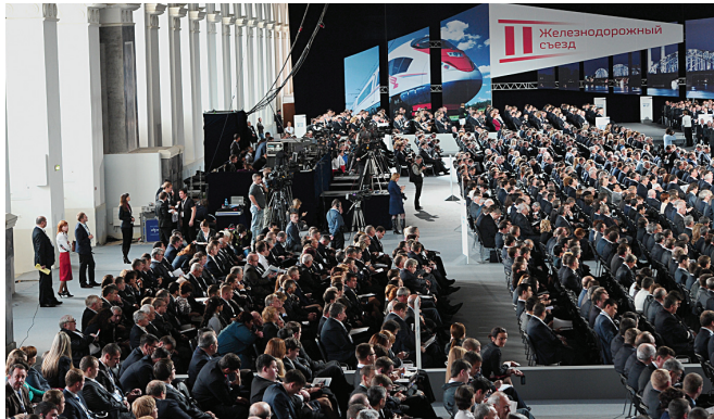
Железнодорожники – за модернизацию экономики

На съезде было отмечено, что важнейшим приоритетом развития отрасли является обеспечение безопасности перевозочного процесса, повышение уровня антитеррористической