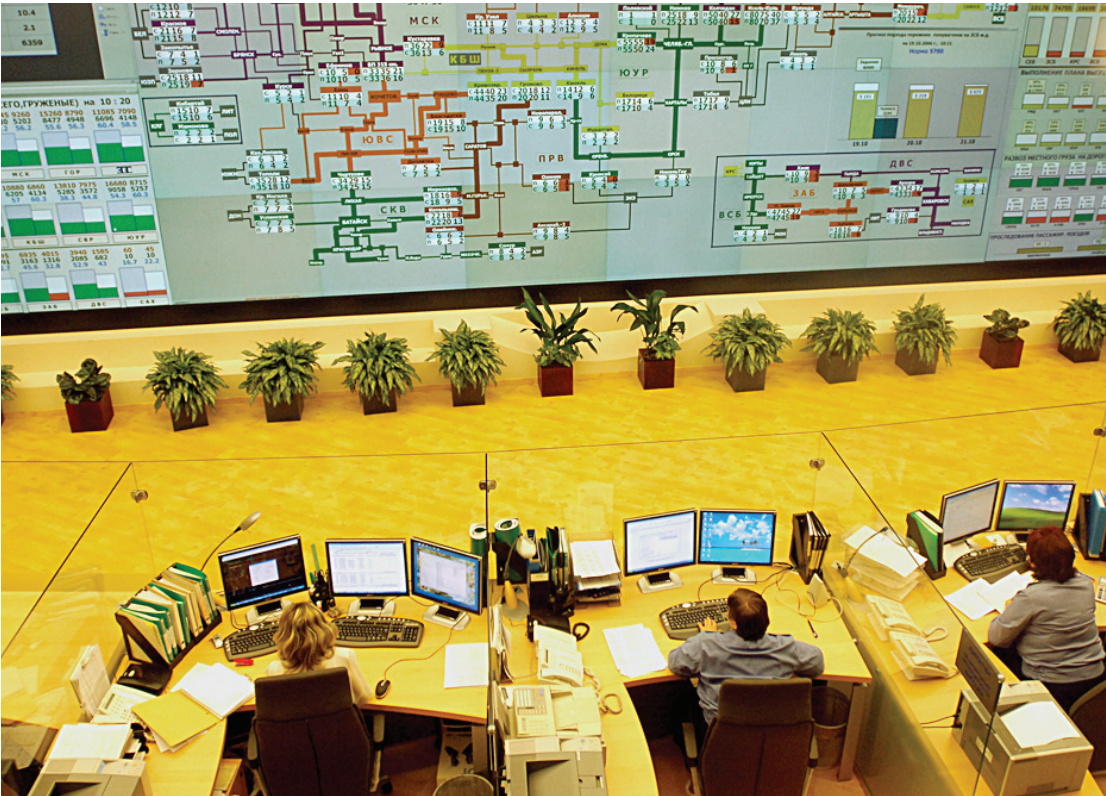
В основе создания вертикалей управления – эффективность работы в новых экономических условиях

вошли такие комплексы, как путевой, электрификации и электроснабжения, автоматики и телемеханики, часть вагонного хозяйства и ряд объектов технологического и коммунального назначения. Тем не менее формирование Дирекции инфраструктуры ещё