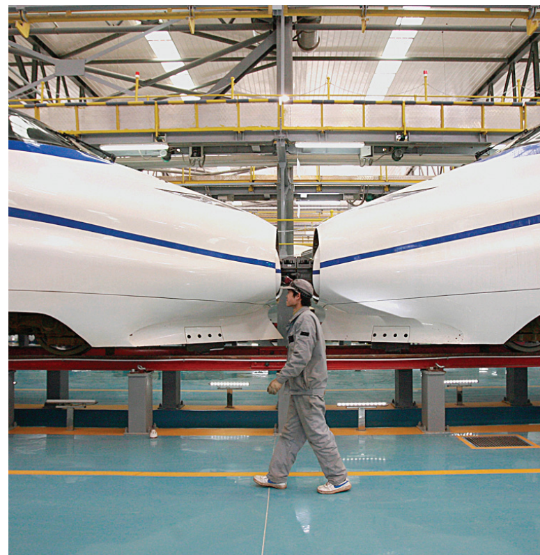
Для высокоскоростных магистралей понадобится новейший подвижной состав

Строительство высокоскоростной магистрали от Москвы до Санкт-