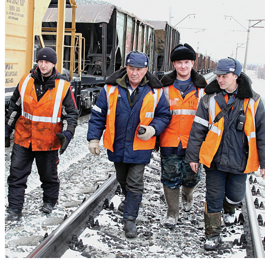
Любой рядовой работник мог поучаствовать в деле усовершенствования системы премирования

На уровень департамента поступило 11 предложений, которые требуют внесения изменений в общее