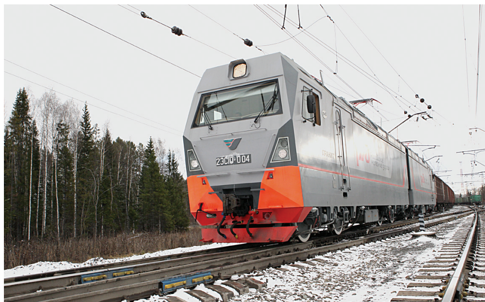
Электровоз «Гранит» не имеет аналогов не только в России, но и на всём «пространстве 1520»

ЗАО «УК «Брянский машиностроительный завод», также входящее в ЗАО «Трансмашхолдинг», разработало магистральный грузовой тепловоз с асинхронным приводом 2ТЭ25А «Витязь». Он представляет собой двухсекционный 12-осный тепловоз с поосным регулированием силы тяги. Испытания показали, что по тяговым характеристикам и энергоэффективности он существенно превосходит тепловозы, эксплуатируемые сегодня на сети. В апреле текущего года «Витязь» успешно прошёл испытания по оценке возможности вождения поездов массой 6 тыс. тонн на затруднительных участ-