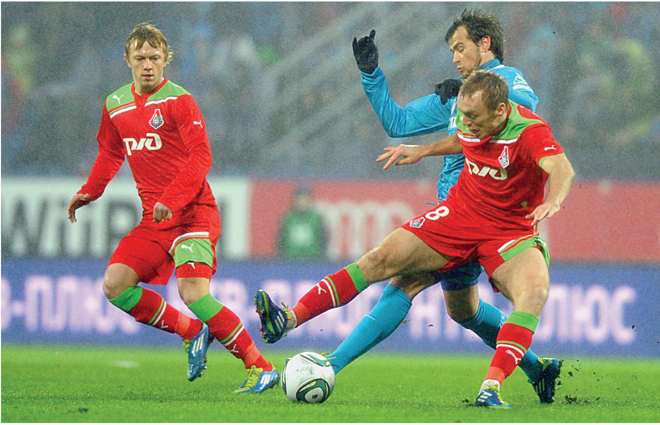
Полузащитник Денис Глушаков (№ 8) стал автором единственного гола «Локомотива» в матче против «Зенита»