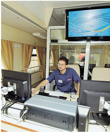
Компьютерные технологии помогут путейцам

ВСЮ ТЕХНИКУ ДЛЯ РЕМОНТА ОСНАСТЯТ СРЕДСТВАМИ СПУТНИКОВОЙ НАВИГАЦИИ