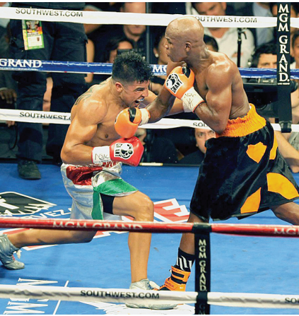
Мейвезер (справа) одержал победы во всех своих 42 боях, из которых 26 завершились нокаутами противников

АМЕРИКАНЕЦ ФЛОЙД МЕЙВЕЗЕР-младший, одолев Виктора Ортиса, стал чемпионом мира в полусреднем весе по версии Всемирного боксёрского совета. Бой завершился нокаутом и скандалом. Мейвезер – боксёр уникальный. Он выигрывал титулы чемпиона мира в пяти категориях и не потерпел ни одного поражения за карьеру. Боксёрский мир ждал, сможет ли остановить победную поступь Мейвезера боксёр не менее классный – на тот момент обладатель пояса Виктор Ортис. Сам бой, который прошёл в Лас-Вегасе, получился на загляденье. Первые три раунда поединка прошли в равной борьбе, соперники осыпали друг друга градом ударов, и зрители были в восторге. Но в четвёртом раунде Ортис поступил не по-джентльменски, боднув соперника головой в губу, которую разбил до крови. Впрочем, в перерыве Виктор подошёл к углу соперника и извинился. Мейвезер извинения вроде бы принял, но