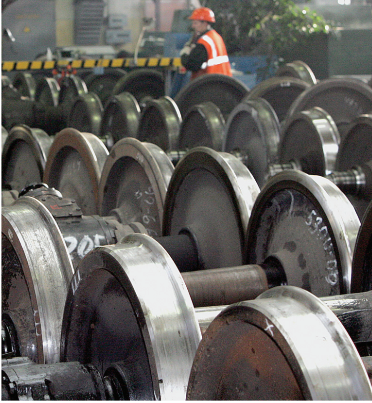
ПРОБЛЕМА ДЕФИТА КОЛЁСНЫХ ПАР РЕШИТСЯ С ОТКРЫТИЕМ НОВОГО ЦЕХА

«Даже при круглосуточном режиме работы колёсно-роликовых цехов их