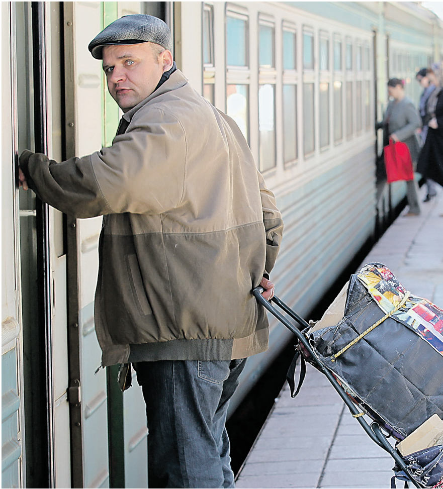
Приучить всех пассажиров приобретать билеты – основная задача перевозчика

В планах компании по итогам работы за год добиться хотя бы нулевой рентабельности. Шансы для этого есть. Во-первых, перевозчик совместно с правительством Самарской области и ОАО «РЖД» выработал алгоритм погашения задолженности перевозчика перед дорогой. За аренду подвижного состава и услуги локомотивных бригад платит перевозчик. Дорога оплачивает перевозку своих сотрудников. Регион, в свою очередь, выплачивает компенсацию согласно госзаказу. На текущий год в областном бюджете на предоставление субсидии СППК заложено около 200 млн руб.,