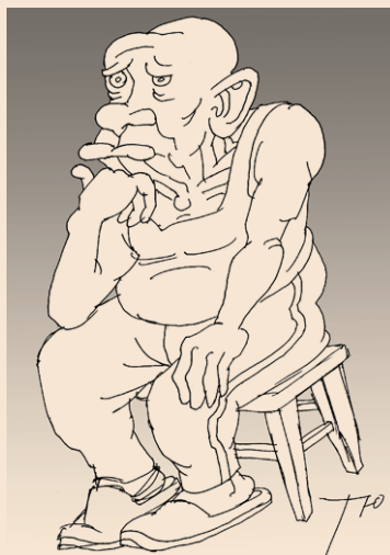
РИСУНОК: СЕРГЕЙ ТОНИН

Григорий Фёдорович такой же простой, как все мы. Только глаз у него зоркий, слух острый да ум аналитический. Поэтому он считает первоочередной задачей делиться с нами своим восприятием жизни.