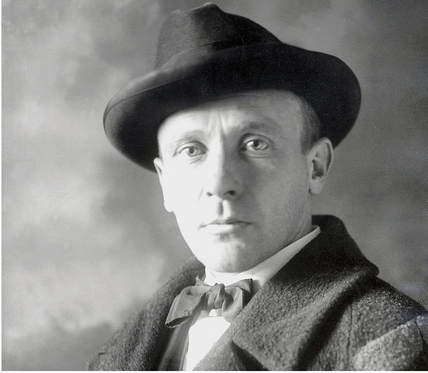
Булгаков очаровал всю редакцию светской изысканностью манер

В конце концов после долгих скитаний по разным углам поселился в доме № 10 по Большой Садовой улице, в легендарной квартире № 50. А она, как известно, стала прообразом той самой «нехорошей квартиры», где обосновался Воланд со свитой и где сейчас находится Музей Булгакова. Отсюда, с Большой Садовой, он ездил на Солянку, в газету «Гудок». Здесь с апреля 1922 года, как отмечают биографы, Булгаков обрёл наконец «прочное место в жизни» – должность литобработчика в отделе писем. Много времени уделял коллективной работе в отделе «четвёртой полосы». В этом отделе «Гудка» собралась фантастическая компания. Что ни имя, то литературная звезда: Михаил Булгаков, Юрий Олеша, Илья Ильф, Евгений Петров. К ним постоянно заглядывали Валентин Катаев, Константин Паустовский, Исаак Бабель, Виктор Шкловский. Здесь, по выражению Ильфа, царил «пир остроумия». Булгаков, правда, держался особняком. Его уважали за огромный талант и