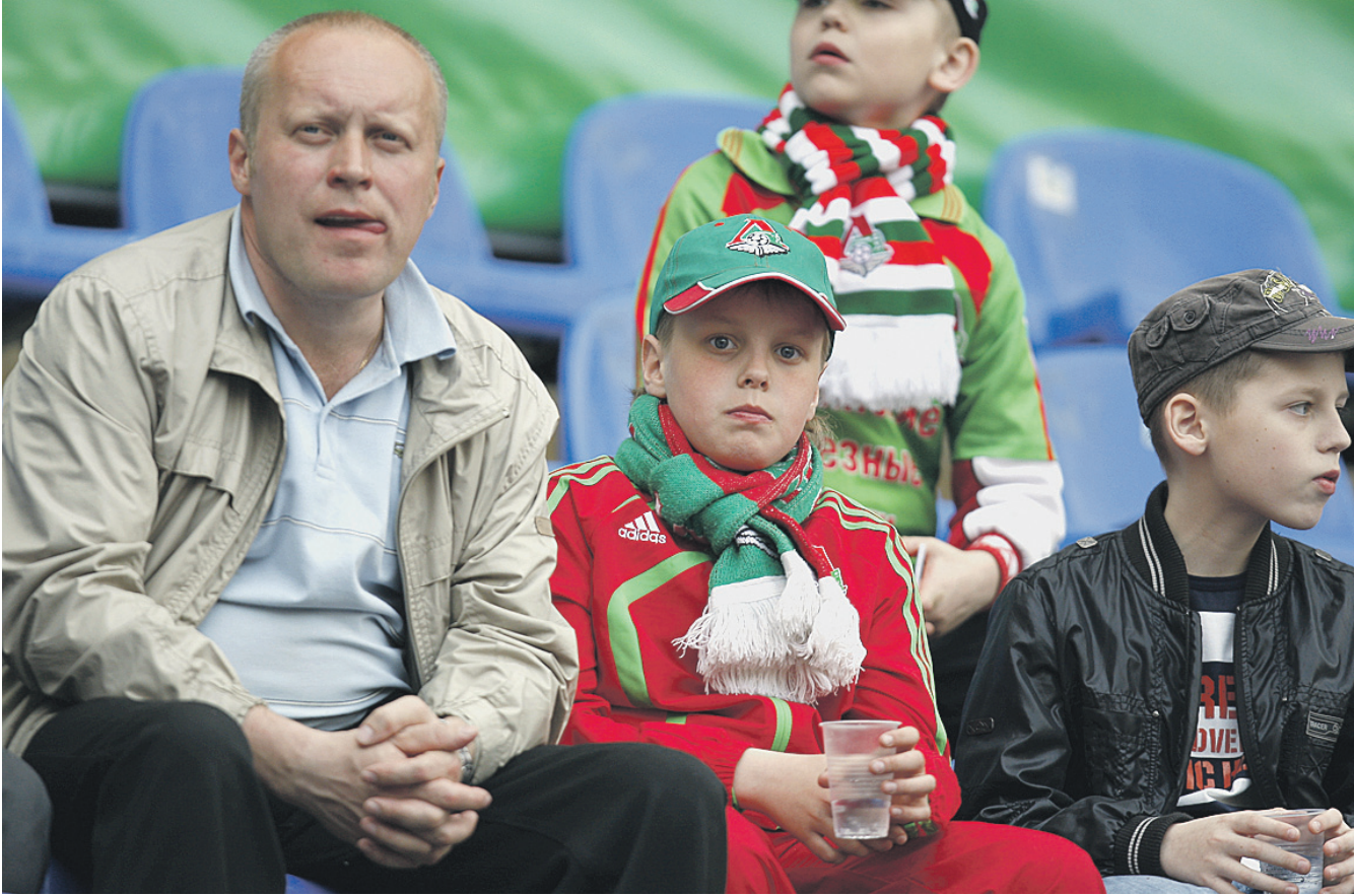
Тот, кто приходит на Черкизовский стадион, становится здесь своим и стремится попасть сюда вновь

На арене в Черкизове как дома чувствуют себя и папы, и мамы, и ребята