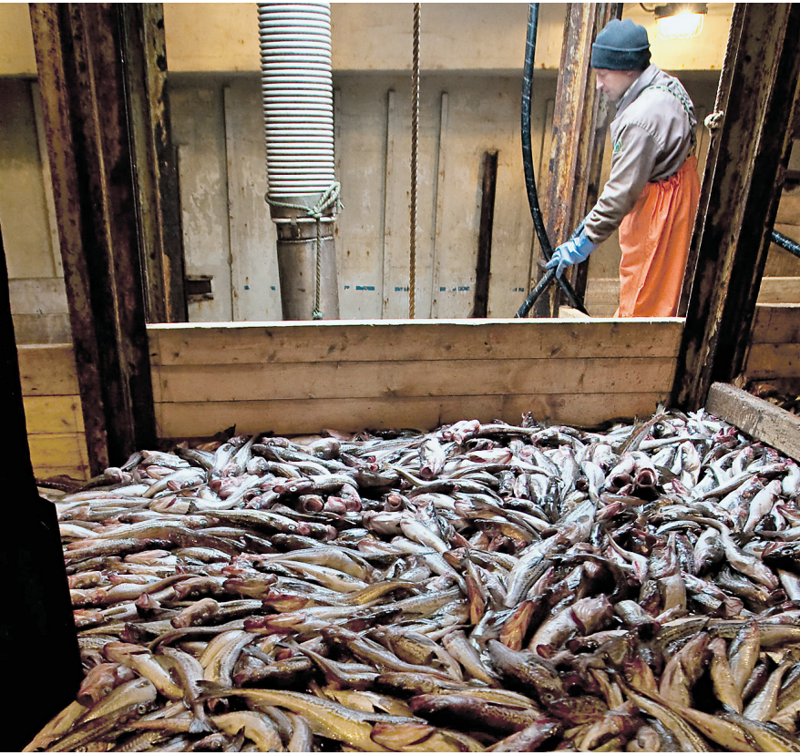
Хорошему улову помогло раннее оформление разрешений на добычу – рыбаки начали промысел уже 1 января

Вместе с тем на магистрали готовятся уже к лососёвой путине, пик которой приходится традиционно на июль – сентябрь. «Чтобы погрузка шла успешно, мы проводим совещания с рыбодобывающими предприятиями и грузоотправителями. Особенно важны тут вопросы оперативной доставки рыбной продукции от мест лова до розничного потребителя», – говорят на Дальневосточной дороге. При этом, по прогнозам учёных, летне-осенняя путина 2011 года ожидается лучше прошлогодней. Так, по данным, которыми располагает Сахалинское ТЦФТО, возможный вылов тихоокеанских лососей во внутренних во-