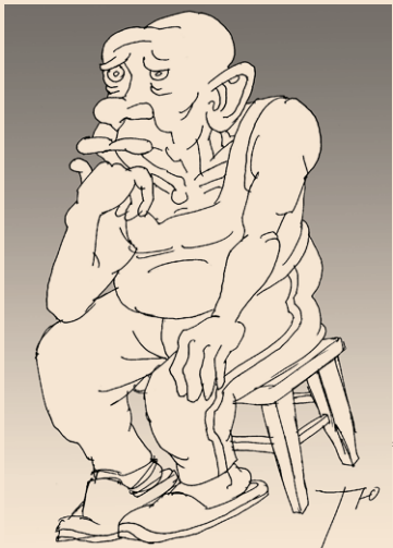
РИСУНОК: СЕРГЕЙ ТОНИН

Читатели «Гудка» хорошо знакомы с Григорием Фёдоровичем. Он такой же простой, как все мы, только глаз у него зоркий да ум аналитический. Поэтому он считает своей главной задачей делиться с нами своим восприятием жизни.