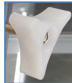
Новая ручка из неподдерживающего горения термопластичного материала