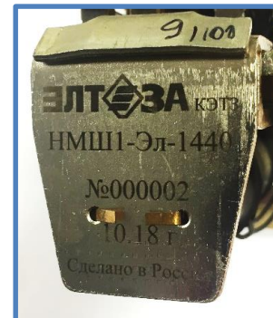
Лазерная маркировка якоря взамен марки производственной