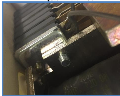
Применение стандартизованных болтов взамен фасонных шпилек