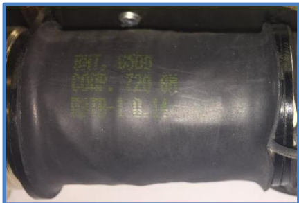
Применение термоусаживающейся трубки неподдерживающей горения