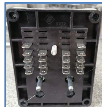
Новое основание из неподдерживающего горения термопластичного материала